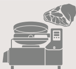
Машины для производства